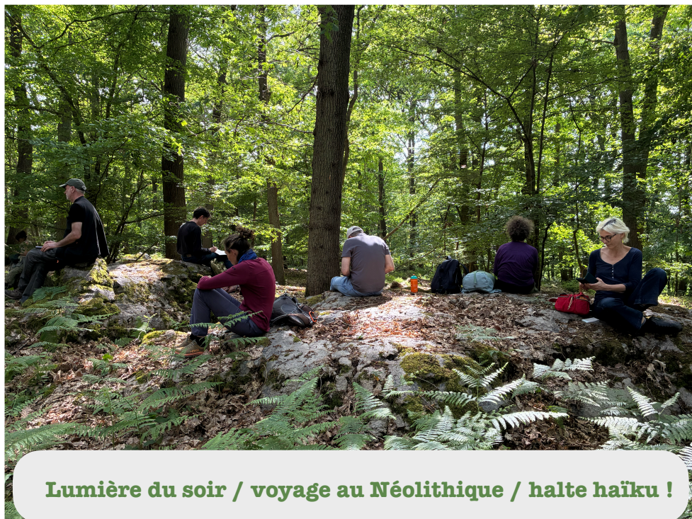
Lumière du soir / voyage au Néolithique / halte haïku !

Nous approchons de l' ourlet de la forêt , cette lisière d'herbacées entre un terrain dénudé et la forêt elle-même. À droite, qui domine ces herbes de sa taille, une renouée du Japon ( Reynoutria japonica ), son nom faisant référence à l'aspect de sa tige aux nœuds très renflés. Elle est considérée comme une plante