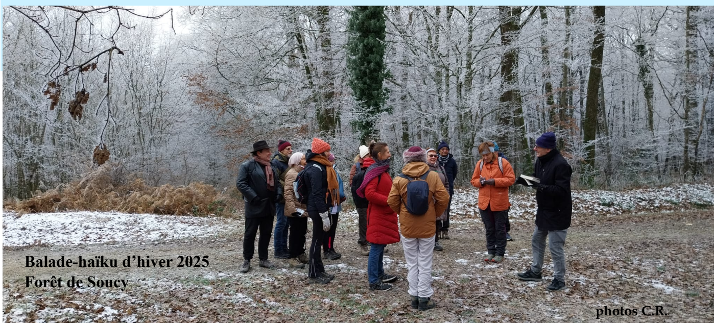
Balade-haïku d'hiver 2025 Forêt de Soucy