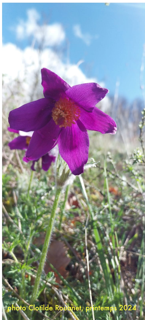
printemps 2024